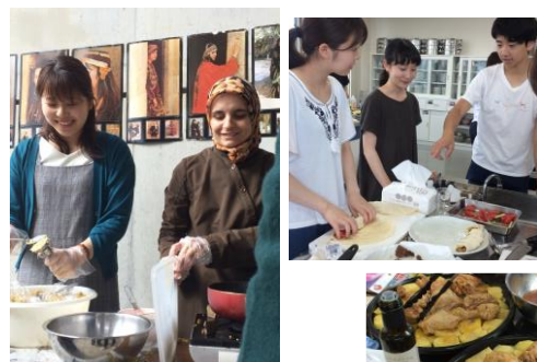
アラブ料理作りにも チャレンジしました。

【宗教】イスラームの聖典「コーラン」はアラビア語で書かれており、アラビア語を介して広くて深い宗教文化に分け入ることもできます。